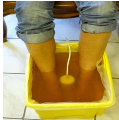
Am Ende des Bades

Gifte lassen sich in unserer alltäglichen Umgebung finden: Tabak, Alkohol, Nahrungsmittelzusätze, Medikament, Pestizide, Schwermetalle und Industrieschadstoffe. Wir sind auf eine optimale Körperfunktion und das Entfernen dieser Gifte aus unseren Systemen angewiesen, da sie schädliche Abfallprodukte sind, die unser Immunsystem angreifen und Müdigkeit, Kopfschmerzen, Erkältungen, Grippe usw., wobei sich die Liste beliebig fortführen lässt. So gibt es eine Theorie, nach der die Entgiftung in gewisser Hinsicht als eine alternative zur Vorbeugung gegen Immunschwächekrankheiten vorgebracht werden kann.