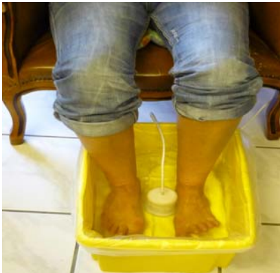
Zu Beginn des Bades

Die Infrarotaufnahmen zeigen deutlich die gesteigerte Blutzirkulation nach der Durchführung der Behandlung mit dem Bio-Energiser für lediglich 15 Minuten (rechts) im Vergleich mit der vor der Behandlung gemachten Aufnahme (links).